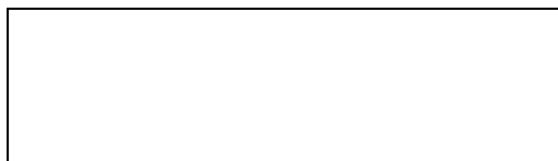
Схема границы балансовой принадлежности

д) границей эксплуатационной ответственности объектов централизованной системы водоотведения исполнителя и заявителя является: